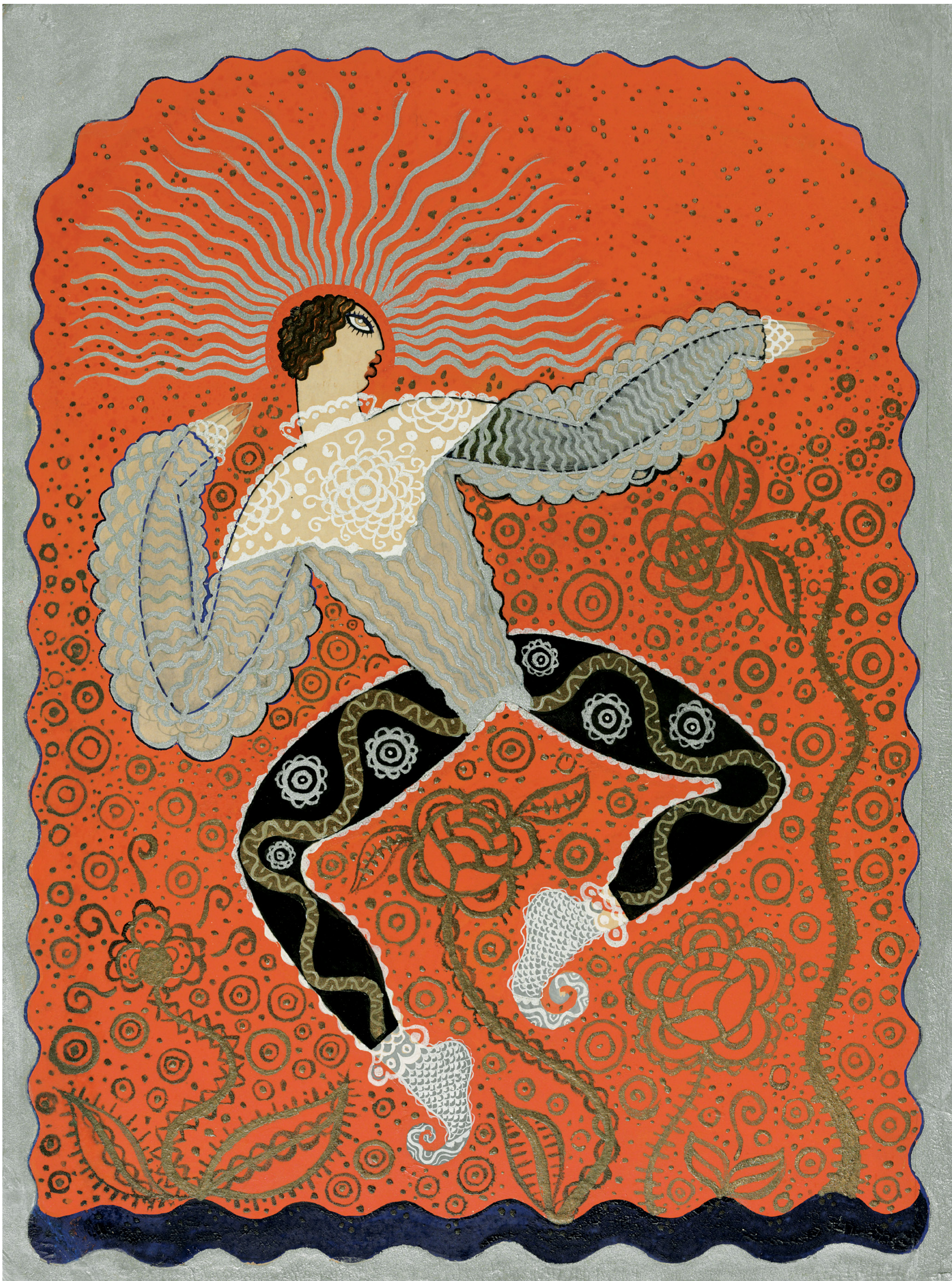
Untitled (Dancer) , c. 1922, by Emilio Amero