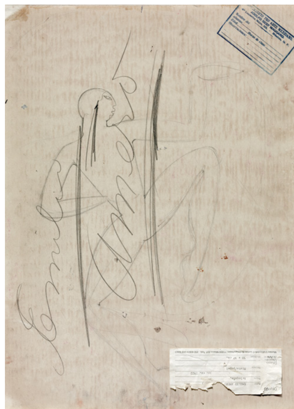
Untitled (Dancer), reverse

The Mexican government, believing the method reflected the new nation's ideals, instituted it in elementary schools around Mexico City from 1921 to 1924. By using simple forms to construct complex images, the Best Maugard method made learning to draw widely accessible. The recipe did not limit individual expression and creativity but set the groundwork for individual artists to transform or recombine motifs in new ways. In contrast to the way earlier regimes limited access to visual arts training to an elite minority, the new curriculum democratized art education by supporting the individual creativity and self-expression of all citizens of the new Mexico.